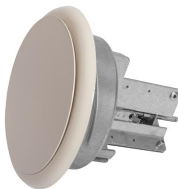
smeltlood 72 graden Celsius

Voor bestellingen: Sales@hpsmail.nl - 0593-33 17 76