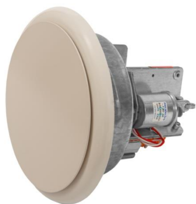
Elektrisch aangestuurd ventiel